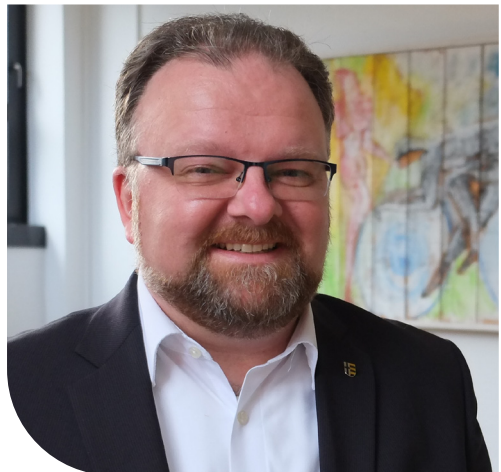
Bürgermeister Marc Venten